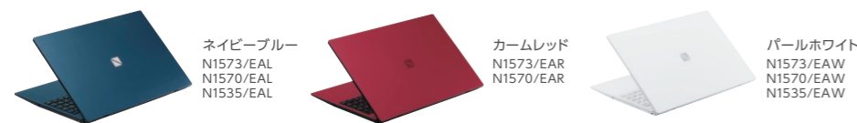
ネイビーブルー N1573/EAL N1570/EAL N1535/EAL